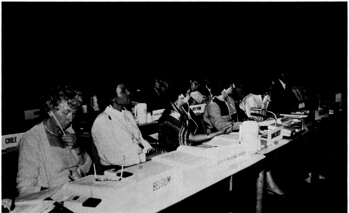
UN End of Decade Conference for Women